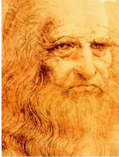
Leonard de Vinci